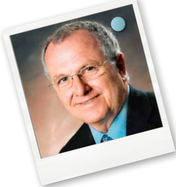
amtshührender Landesschulrats-Präsident a. D.